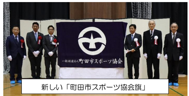
新しい「町田市スポーツ協会旗」