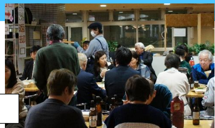
祝賀会・壮行会会場