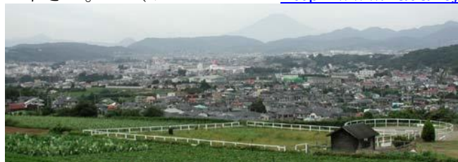
雄大な富士山が望めます

車利用の場合：東名高速「秦野・中井インター」より6分、または246号利用で善波トンネルを出てすぐに左折(入り口に案内の看板あり)。詳しい行き方は乗馬クラブに直接お問い合わせ下さい。(ホームページ http://www.hadanojouba.com/ )