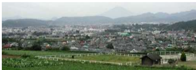
<富士山の四季の眺望が楽しめます>

車利用の場合：東名高速「秦野・中井インター」より6分、または246号利用で善波トンネルを出てすぐに左折(入り口に案内の看板あり)。詳しい行き方は乗馬クラブに直接お問い合わせ下さい。(ホームページ http://www.hadanojouba.com/ )